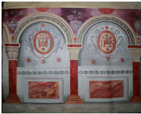
Décors muraux restitués sur un support mobile...