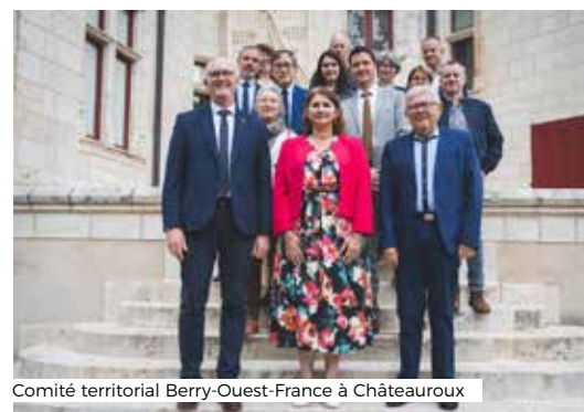
Comité territorial Berry-Ouest-France à Châteauroux