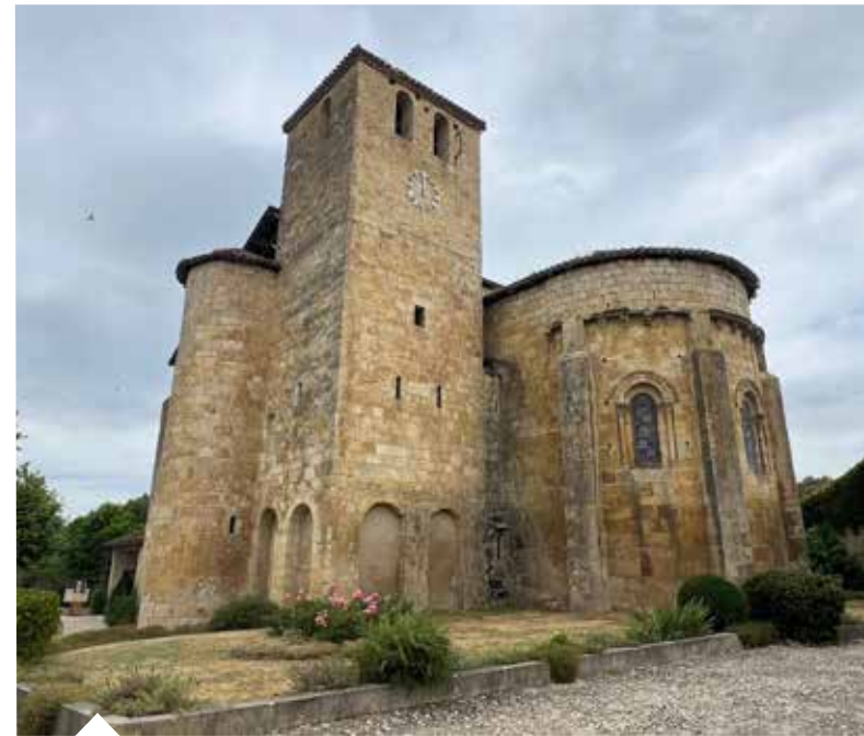
Les participants ont pu découvrir le site de Mouchan le dimanche 6 juillet 2025