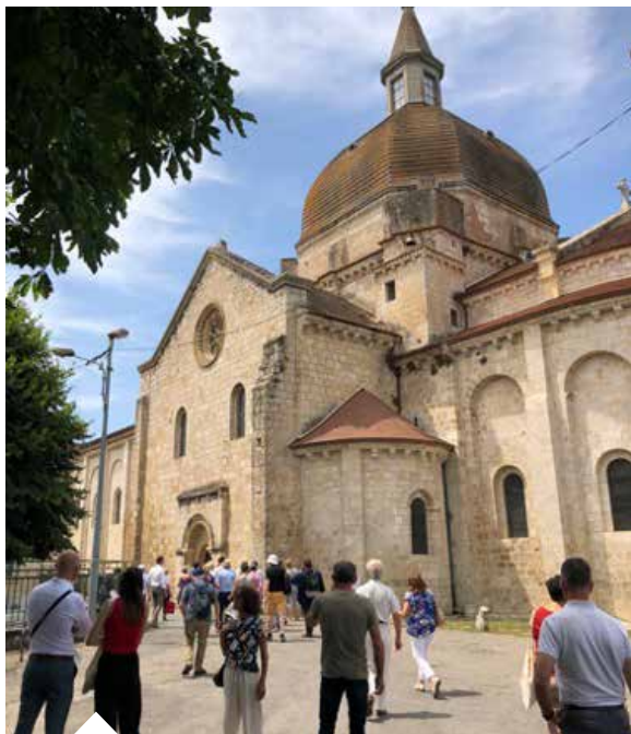
Visite de l'ensemble prieural de Layrac, proposée par Jean-Luc Moreno et l'équipe de Destination Agen, le 5 juillet 2025