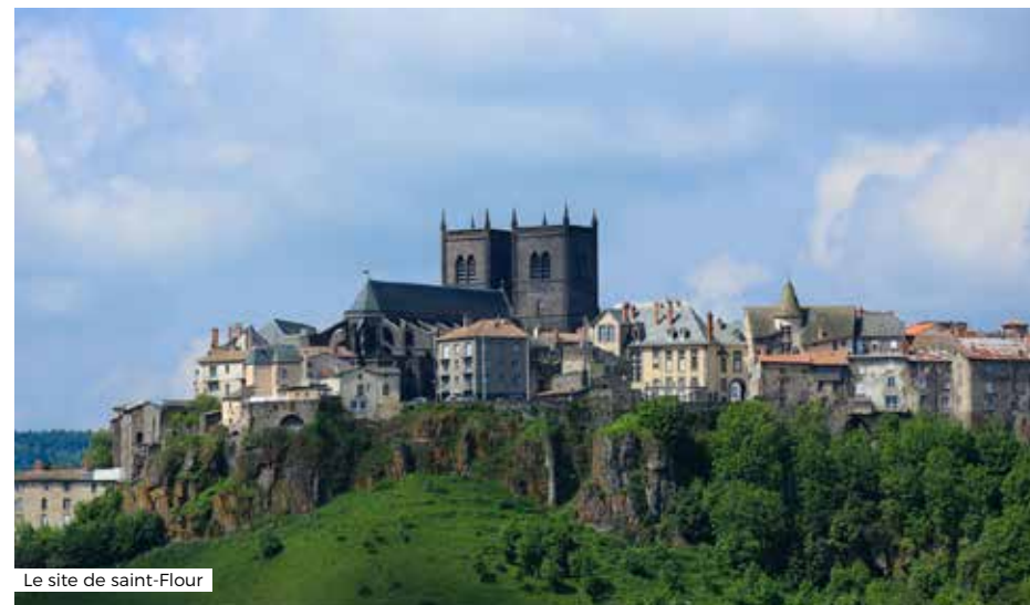
Le site de saint-Flour