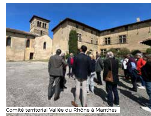
Comité territorial Vallée du Rhône à Manthes

Pour rappel, les comités territoriaux sont des groupes de travail qui concernent l'ensemble des sites membres de la Fédération ; s'y engager activement est l'une des conditions de l'adhésion à la Fédération.