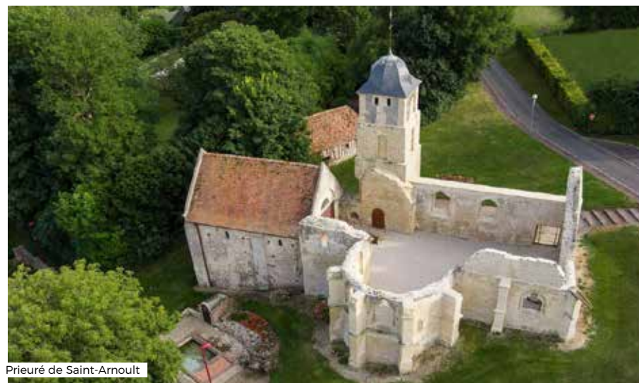
Prieuré de Saint-Arnoult