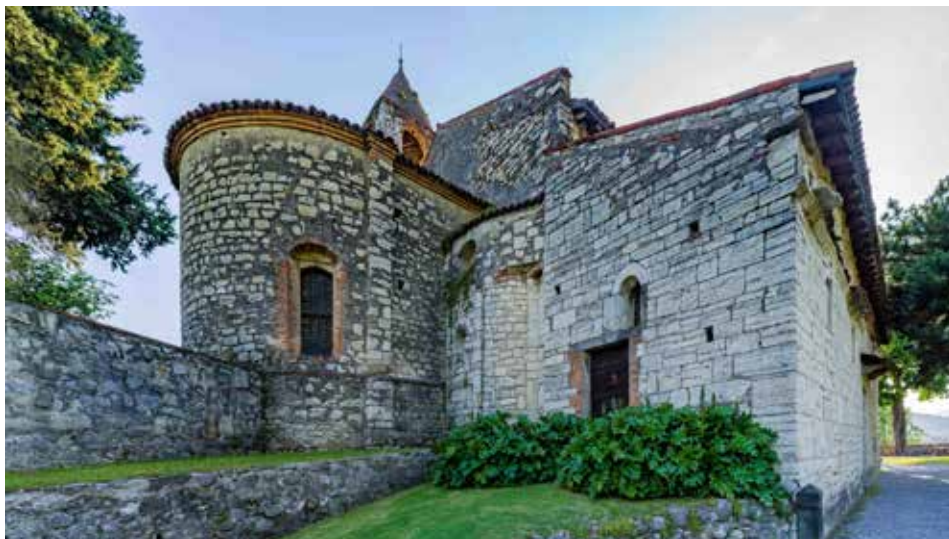
San Pietro de Provaglio d'Iseo