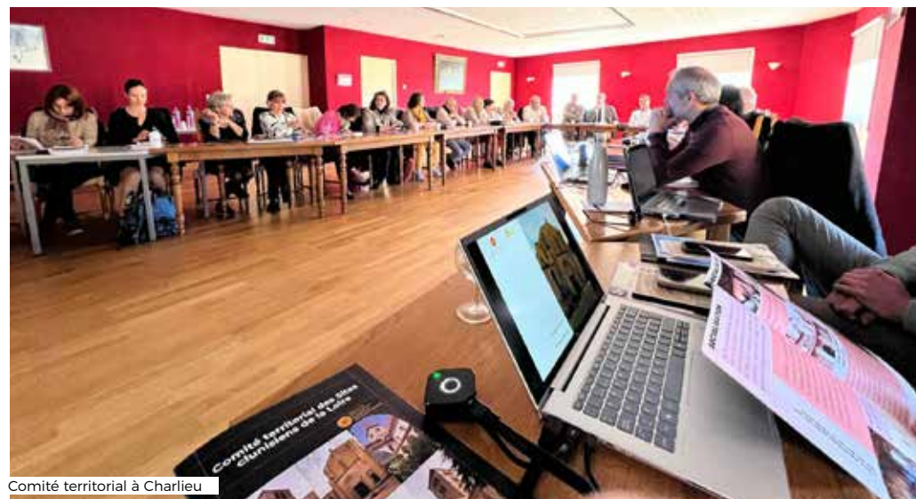
Comité territorial à Charlieu

27 novembre : Longpont-sur-Orge ( Essonne )