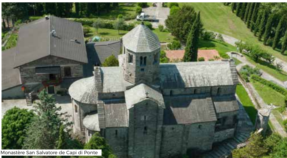
Monastère San Salvatore de Capi di Ponte

En fonction des demandes, un départ en car pourra être envisagé au départ de la France - cf. p. 16